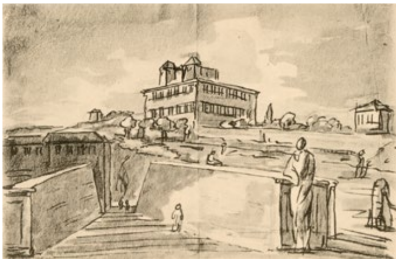
Villa Medici – gemalt von J.W. Goethe