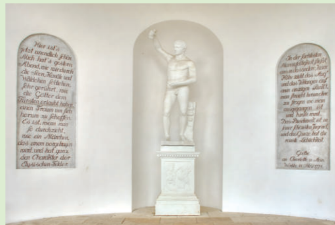
Innenansicht des Nymphäums

Goethes Spuren im Gartenreich sind bis heute vielfältig und finden in dieser Ausstellung erneut ihren Ausdruck. Doch auch in der Vergangenheit wurden seine Spuren und Einflüsse immer wieder thematisiert und im Gartenreich anschaulich gemacht, so dass man heute das Gartenreich ohne Goethe kaum denken kann. Im Jahr 1928 brachte man Goethes für Charlotte von Stein verfasste Briefzeilen, wie „unendlich schön“ es in Wörlitz sei, auf zwei Tafeln im Nymphaeum im Wörlitzer Park an. Dort befinden sie sich noch heute. Mit dieser Ergänzung der Tafeln fand eine jahrzehntelange Beschäftigung mit den Spuren des Dichters einen architektonischen Ausdruck. Es entstanden zahlreiche Publikationen mit Goethe-Bezug und das Dessauer Theater spielt seit über 200 Jahren Goethes Stücke.