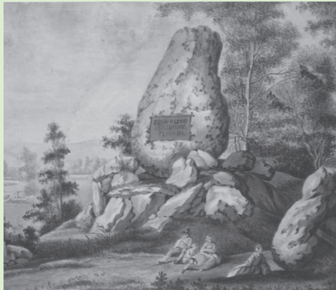
Der Dessauer Stein im Weimarer Park Grafik: Georg Melchior Kraus (1737 - 1806)

Raffael im Original sehen können. Aber auch zeitgenössische Künstler und Künstlerinnen sollten sein Kunstverständnis maßgeblich prägen. So traf er die Malerin Angelika Kauffmann in Rom, mit der sich eine enge Freundschaft entwickelte und deren Werk „Amor und Psyche“ er später nach dem Erwerb durch das Dessauer Fürstenpaar im Schloßchen Luisium bewundern konnte.