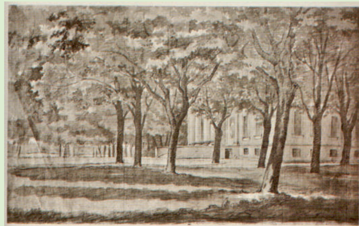
26. Mai 1778: Goethes Zeichnung des Schlosses Wörlitz

im Jahre 2026 feiern wir ein kleines, aber für das Gartenreich Dessau-Wörlitz bemerkenswertes Jubiläum. Denn vor genau 250 Jahren, im Jahre 1776, war Johann Wolfgang von Goethe zum ersten Mal zu Gast in Anhalt und besuchte auch die Gärten des Fürsten Franz von Anhalt-Dessau. Dieser Besuch verlief nicht ohne Folgen und Goethe wurde so ein bis heute viel zitierter Botschafter für das Gartenreich. Weitere sechs inhaltsreiche Besuche in Anhalt-Dessau sollten folgen. Dazu hat sich die Anhaltische Goethe-Gesellschaft mit der Kulturstiftung Dessau Wörlitz und der Gesellschaft der Freunde des Dessau-Wörlitzer Gartenreiches starke Partner gesucht und gemeinsam Besonderes vorbereitet. Eine Ausstellung in diesem Sommer wird in sechs Themenkreisen verschiedene Inhalte von Goethes Besuchen hierzulande beleuchten, nach Spuren suchen und der Frage nachgehen, was davongeblichen ist. Die Ausstellung wird diese Aspekte mit passenden Kunstwerken und Objekten illustrieren und auch ein Faksimile des berühmten Brief Goethes an Charlotte von Stein aus Wörlitz „...hier ists ietzt unendlich schön...“ wird erstmals im Gartenreich zu sehen sein. Eine Zeittafel wird Goethes Leben und die Ereignisse im Gartenreich gegenüberstellen und die Besuche Goethes als Schnittstellen beider Zeitstränge herausstellen. Wir laden Sie ein, mit uns auf Entdeckungsreise zu gehen.