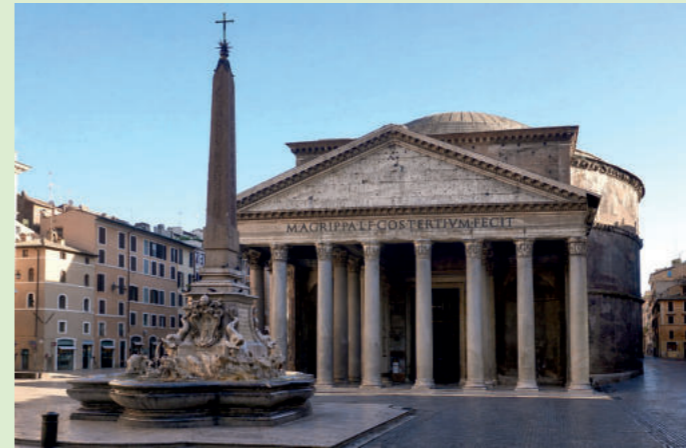
Pantheon in Rom, erbaut ca. 125 n.Chr.

Das Gartenreich Dessau-Wörlitz entstand ab 1765 als Ausdruck der aufgeklärten Denkweise und Ideen des Fürsten Leopold III. Friedrich Franz von Anhalt-Dessau. Johann Wolfgang von Goethe kommt im Dezember 1776 zum ersten Mal in Begleitung seines Dienstherrn Herzog Carl August von Sachsen-Weimar-Eisenach nach Anhalt-Dessau. Es sollten insgesamt sieben Besuche im Gartenreich des Fürsten Leopold III. Friedrich Franz von Anhalt-Dessau werden. Die englischen Gärten, modernen Bauten, ausgewählten Kunstwerke sowie Musik und Theater hierzulande begeisterten den Dichterrfürsten stets aufs Neue und inspirierten ihn zu eigenen Produktionen.