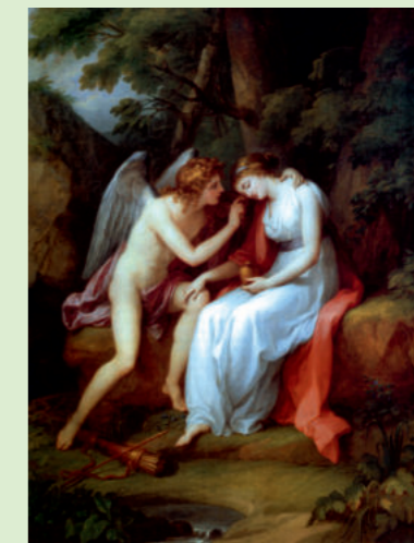
Angelika Kauffmann, Amor und Psyche, 1792

Goethes Kunstverständnis ist weitestgehend von Winckelmanns klassizistischer Interpretation der Antike geprägt. Bei seinen Besuchen im Gartenreich bewundert er die Nachbildungen von Werken antiker Künstler und namhafter italienischer Meister der Renaissance. Bei seiner Italienreise 1786/ 1787 sollte er all diese Meisterwerke von Michelangelo, Tizian