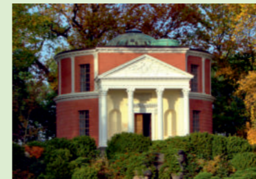
Pantheon, Wörlitz, Anhalt, 1795