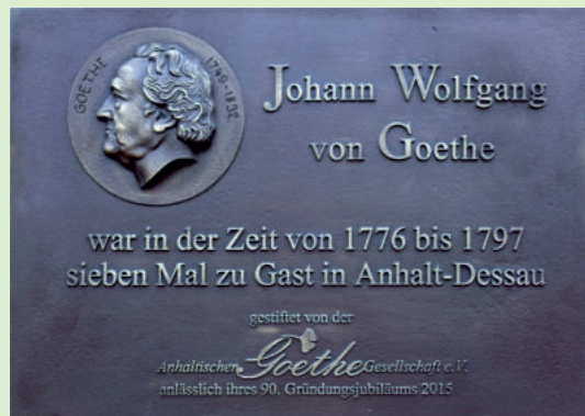
Goethe-Gedenktafel am Dessauer Schloß, 2016

„...hier ists ietzt unendlich schön...“ ...hier ists ietzt unendlich schön