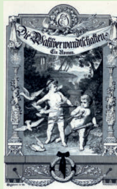
aus: Goethe-Jubiläumsausgabe, 1882 © Deutsche Verlagsanstalt Stuttgart

Die Beschäftigung mit Gärten hat Goethes Werk nachhaltig geprägt. Ob die Gartendarstellungen im „Werther“, die ironische Abrechnung mit der zeitgenössischen Gartenkunst im „Triumph der Empfindsamkeit“, das botanische Lehrgedicht „Die Metamorphose der Pflanzen“ oder der große Gartenroman „Die Wahlverwandtschaften“ – das Thema ist bei Goethe sehr präsent. Auch wenn Goethe kein Dauergast in Dessau war, empfing er hier zahlreiche gartenästhetische Impulse.