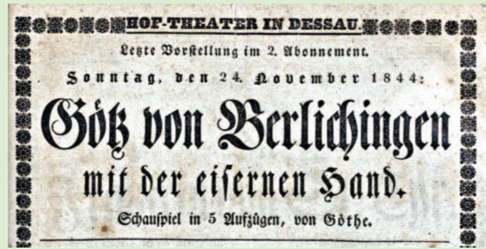
Programmzettel des Hoftheaters Dessau: „Götz von Berlichingen“

Goethe und Wörlitz – Goethe und Fürst Franz: das ist die Geschichte einer Faszination. Man besuchte sich, unterhielt sich über Kunst, Gartenkunst, Theater, Bauwesen, Architektur und regte sich auf vielen Gebieten an. So gibt es vielfältige Wechselwirkungen zwischen der Wörlitzer und der Weimarer Kulturlandschaft. Auch haben die in Wörlitz gewonnenen Eindrücke den Herzog Carl August und Goethe bei der Gestaltung des Parks an der Ilm in Weimar inspiriert. Dies bezeugt u.a. der 1782 dort aufgestellte und schließlich 1787 mit der Huldigungsinschrift „FRANCISCO DESSAVIAE PRINCIPI“ vervollständigte „Dessauer Stein“.