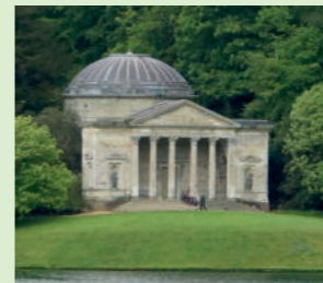
Pantheon, Stourhead, England, 1753